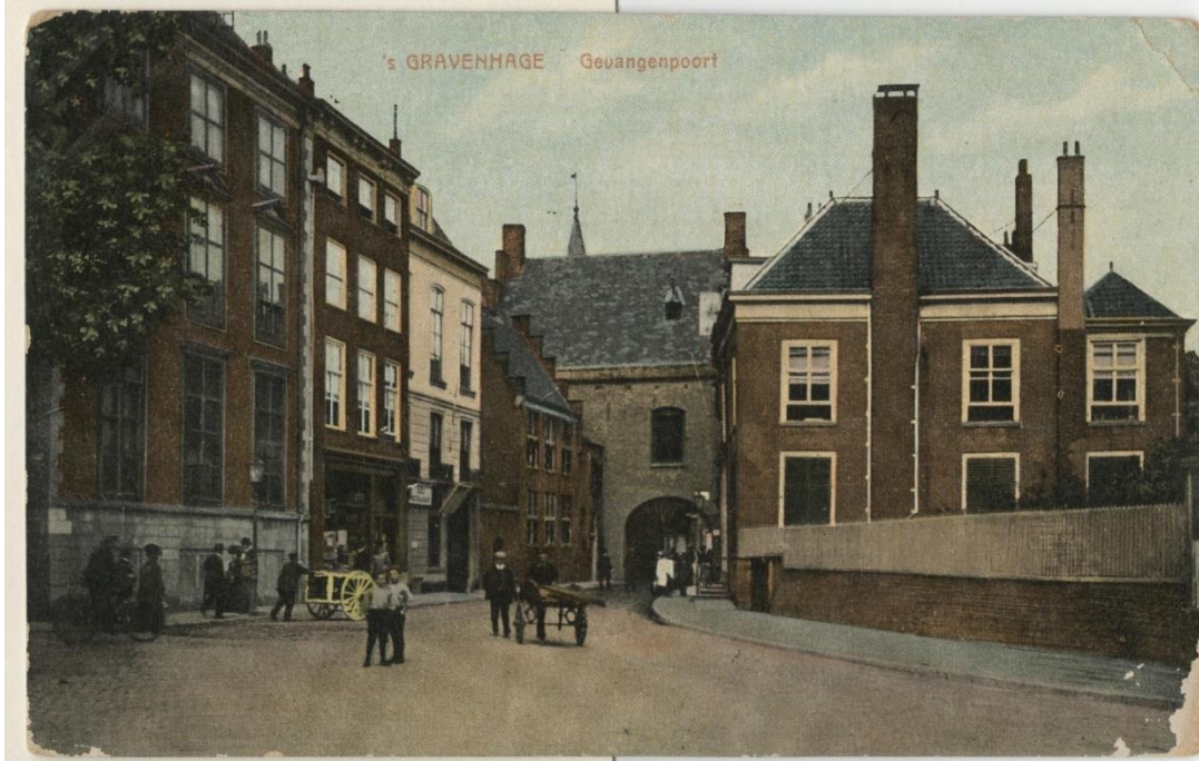
De gevangenenpoort in 1912, voor het gedeelte langs de Hofvijver werd gesloopt

De wandeling begint bij de Gevangenenpoort. Vroeger was dit een echte poort die toegang gaf tot het Buitenhof. Het gebouw is gedeeltelijk gesloopt om ruimte te maken voor het verkeer. Eeuwenlang was dit een echte gevangenis waar zowel eenvoudige als prominente mensen in hebben gezeten. Een van hen was de 17-eeuwse politicus Cornelis de Witt. Het standbeeld van zijn broer Johan de Witt staat op het plein en kijkt uit over de Lange Vijverberg, waar allebei de broers op een gruwelijk manier aan het einde van hun leven kwamen.